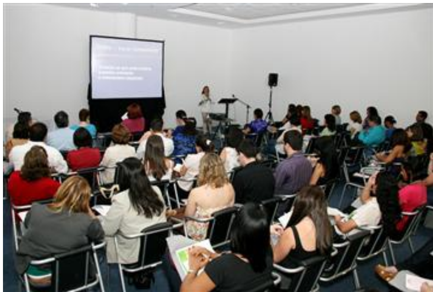
XVI Congresso Hospital Business