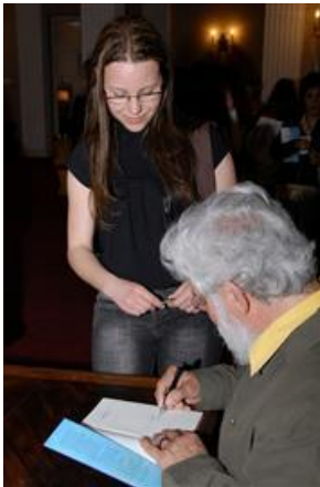
Leonardo Boff - Noite autógrafos