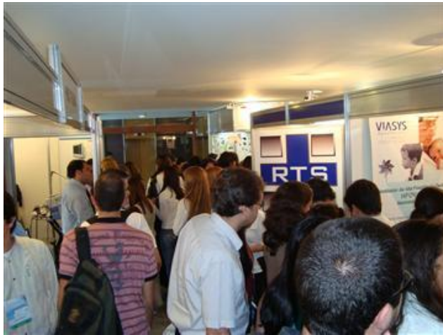
Feira de Fisioterapia Respiratória

Feira de equipamentos, produtos e serviços médico hospitalares Hospital Business