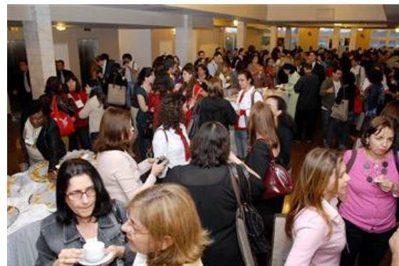
Associação de Hospitais e Clínicas do RJ Coquetel de posse