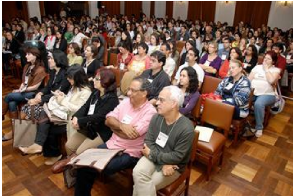
XVI Congresso Internacional Junguiano

Através de consultoria personalizada, a Estrellatum está apta a oferecer todos os serviços necessários para realização e produção dos eventos, divulgação de marcas e captação de novos clientes.